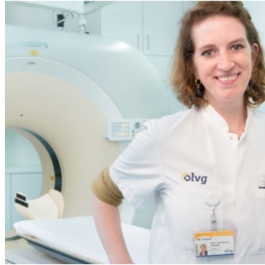
'Neurologen wanen zich geen godheid in het ziekenhuis'