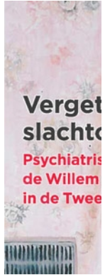
Vergeten geschied psychiatrie in Nederland Tweede V